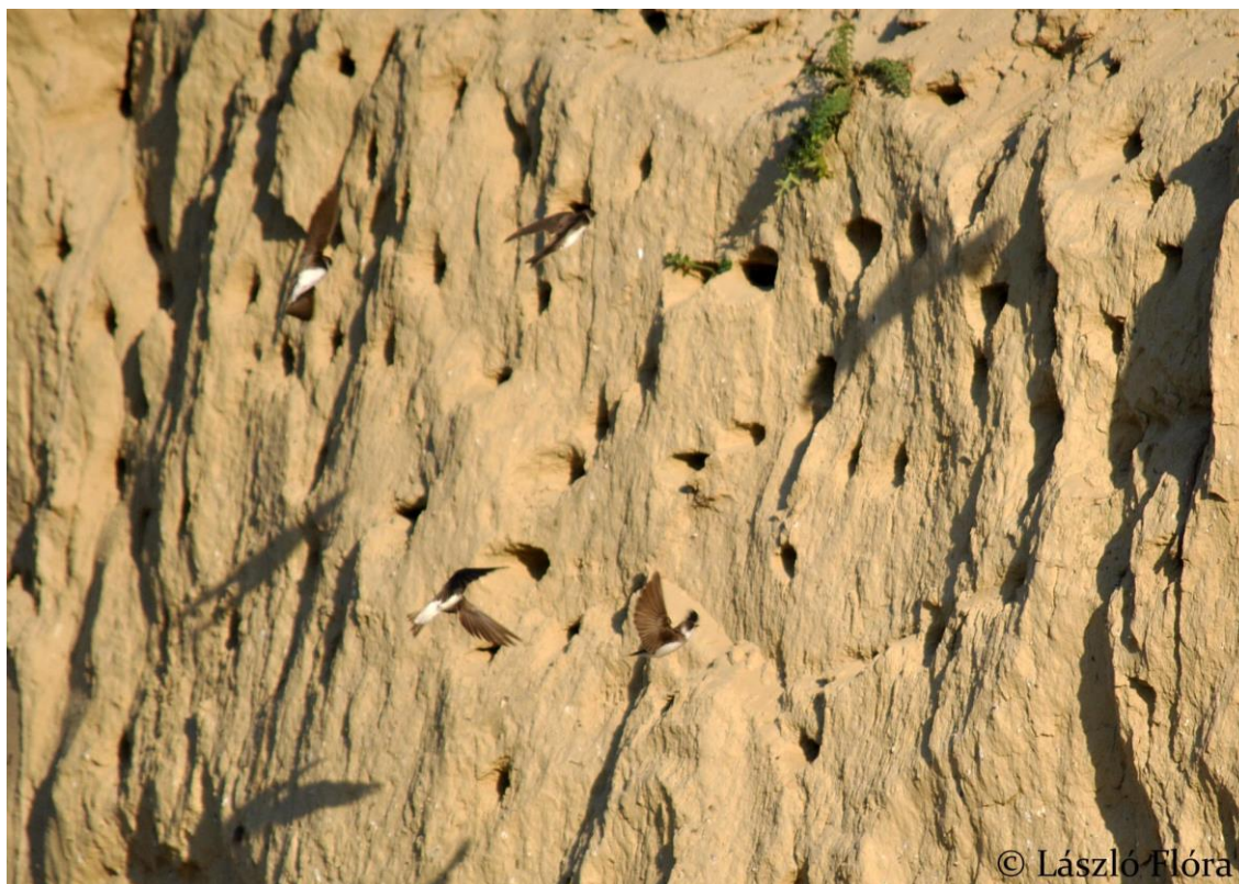
13.7.8-9. fénykép Partifecske telep a Közép-Mezőföld Natura 2000 területen.