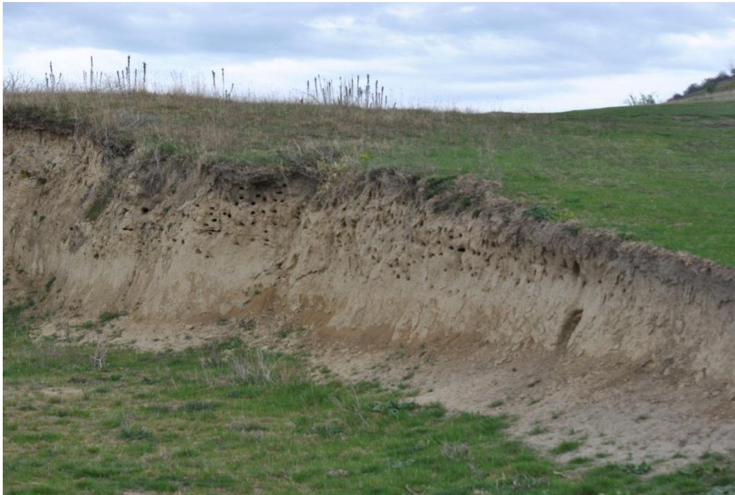
13.7.8-1. fénykép Lössös partfal gyurgyalag és partifecske költőüregekkel a Közép-Mezőföld Natura 2000 területen