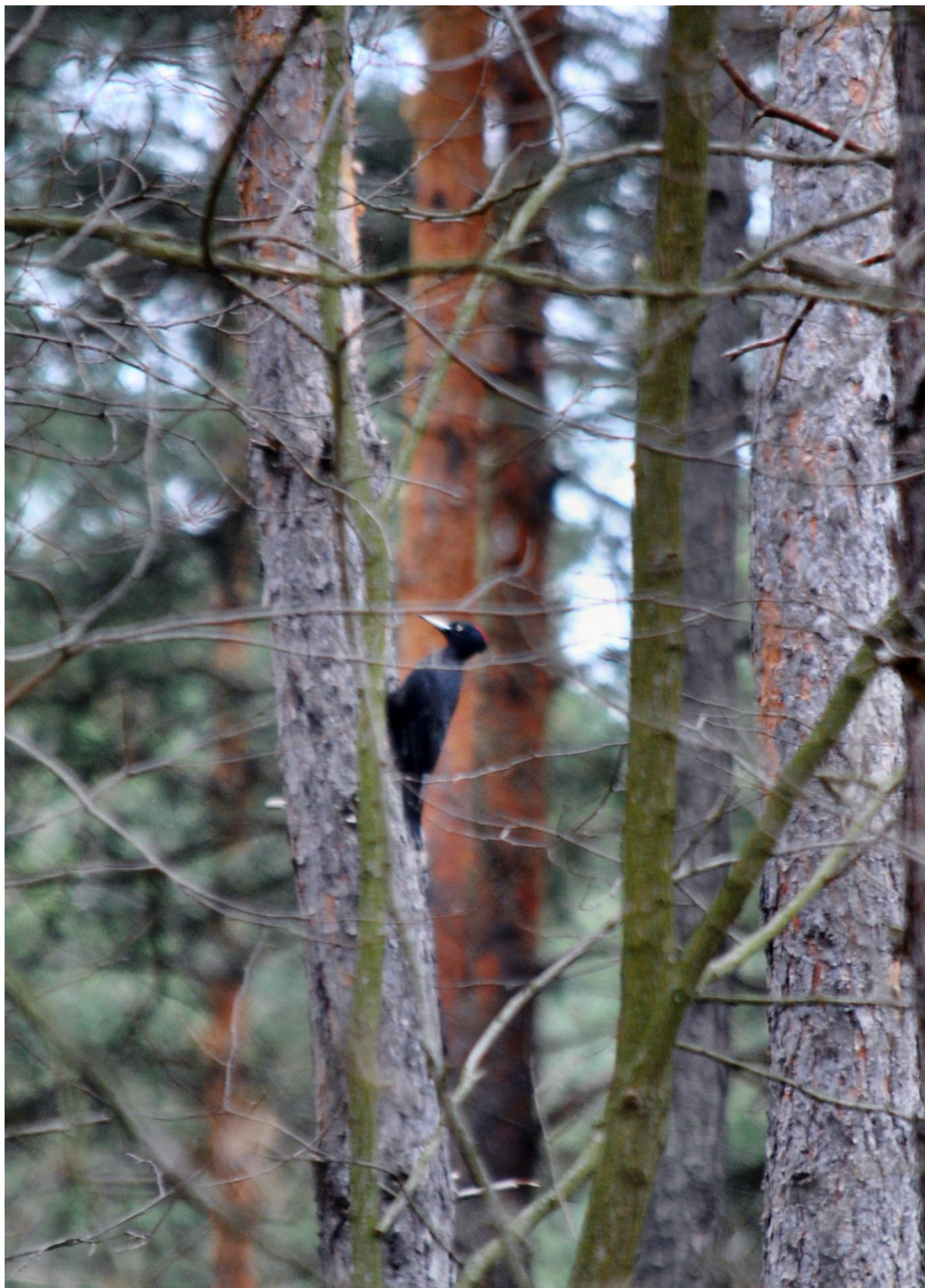
13.7.8-2. fénykép Fekete harkály a fatörzsön a Paksi ürgemező Natura 2000 területén