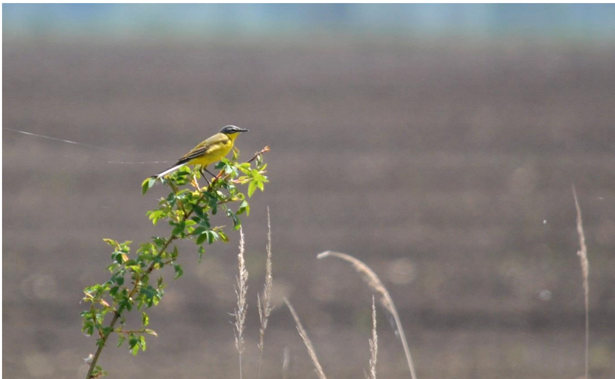
13.7.8-3. fénykép Sárga billegető a Dunaszentgyörgyi láperdő területén