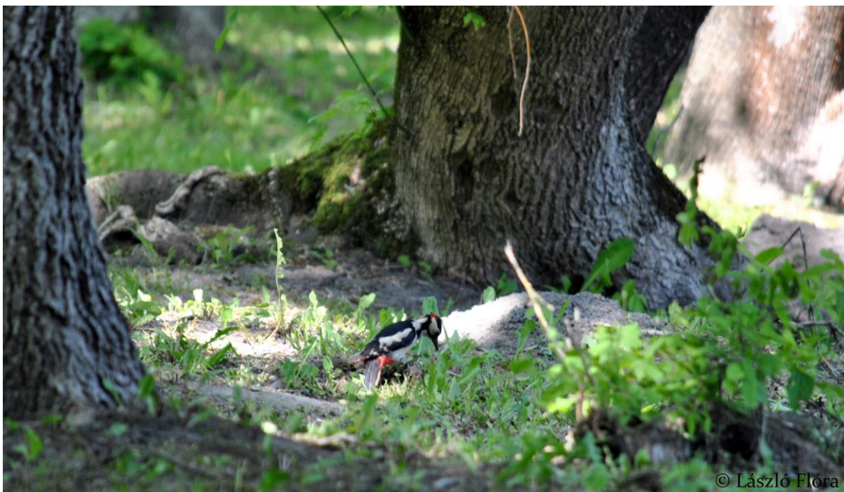
13.7.8-4. fénykép Nagy fakopáncs a Tengelici-rétek Natura 2000 területen.