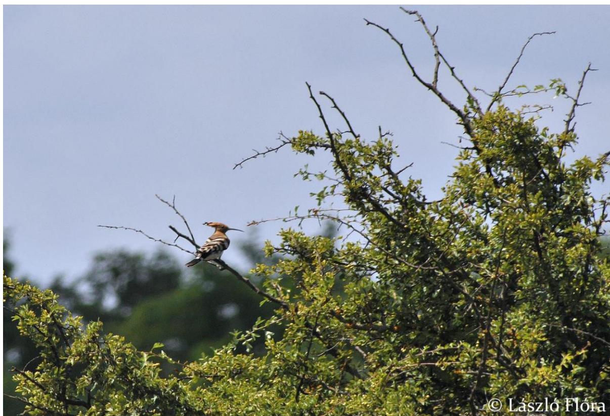
13.7.8-11. fénykép Búbosbanka a Paksi ürgemező Natura 2000 területen.