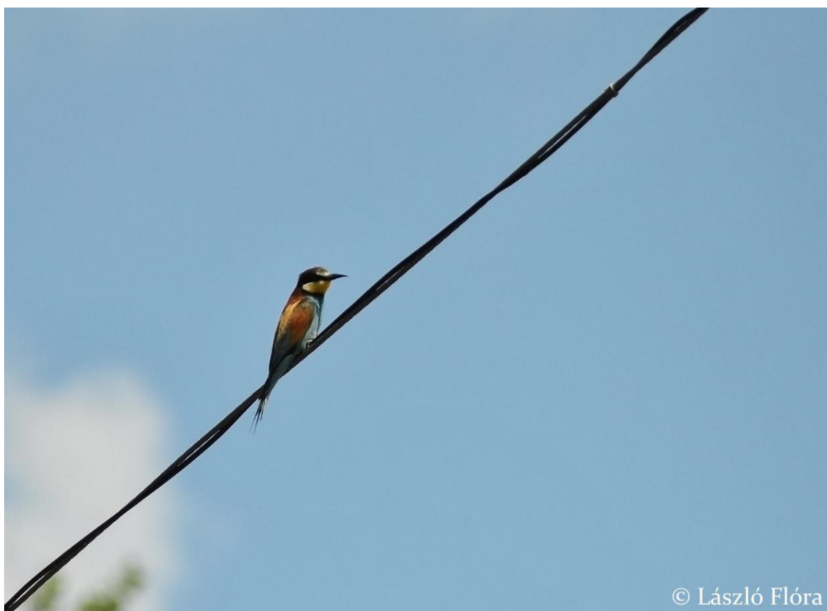
13.7.8-12. fénykép Gyurgyalag a Tolnai-Duna Natura 2000 területen.