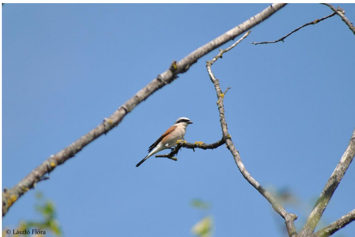
13.7.8-10. fénykép Töviszúró gébics a Dunaszentgyörgyi láperdő területén.